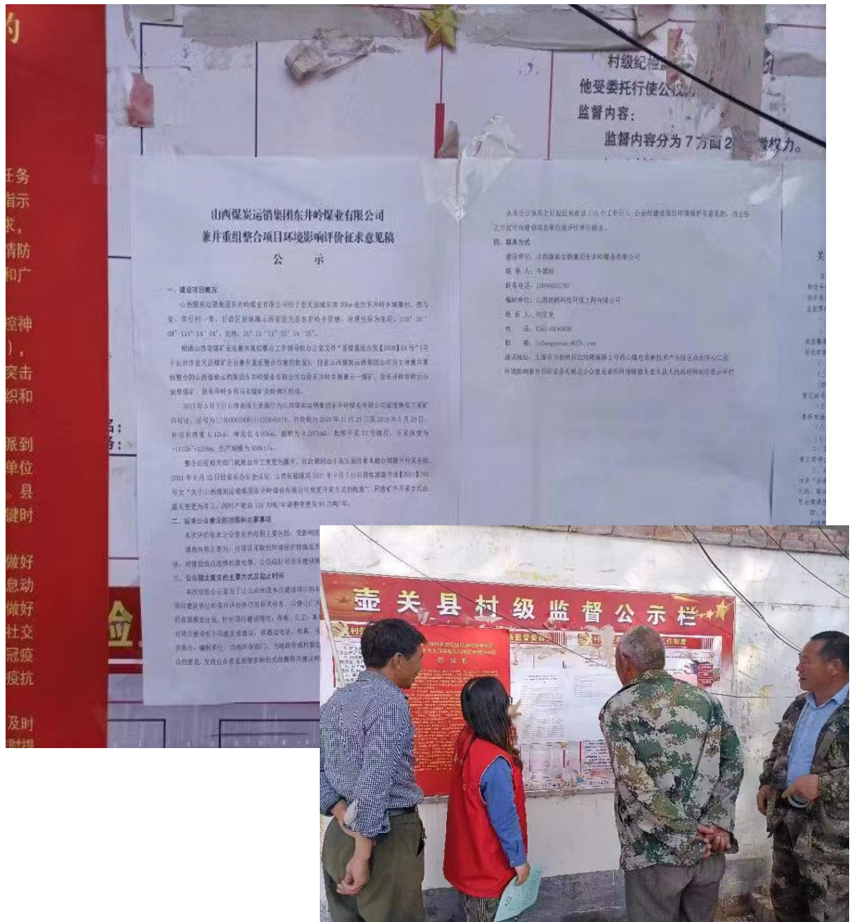
图 6 城寨村现场公示图