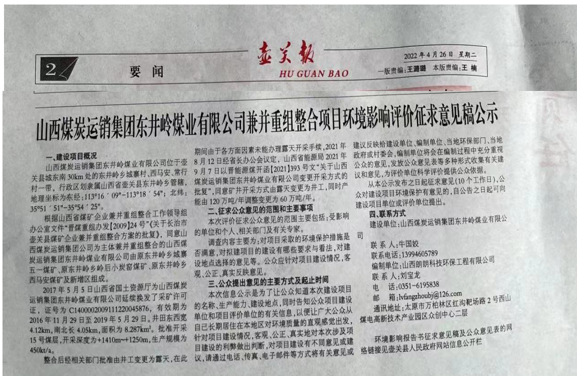
图3 报纸第一次公示图

2022年4月26日和2022年4月29日，建设单位在壶关报上对本项目进行了公示，公示载体及公示期限符合《办法》要求。两次公示截图见下图3、图4。